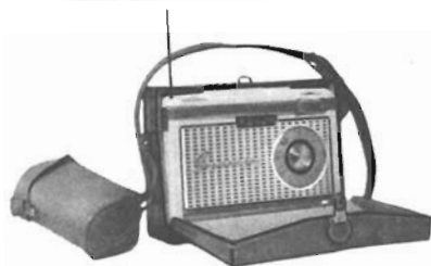
L. 38.800 mobile in materiale plastico antiurto